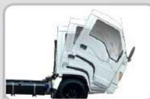
KABIN JUNGKIT Perawatan menjadi mudah