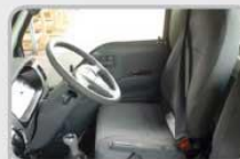
SLIDING SEAT, TILT & TELESCOPIC STEERING Mengemudi Lebih Nyaman