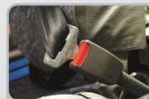
ELR SAFETY BELT & RECLINING SEAT Lebih aman dan nyaman