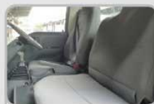
NEW STYLISH SEATER Jok Lebih Tebat