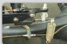
BRAKE PROPORTIONAL VALVE Pengereman lebih aman saat beban berat