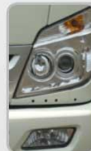
PRO-JECTOR HEAD LAMP & FOG LAMP Lebih Terang dan Bergaya