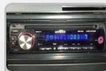
AUDIO CD Perjalanan lebih menyenangkan