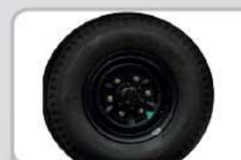
FULL FLOATING REAR AXLE & BAN 7.50-15-12 PR Beban berat tak masalah