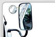
KACA SPION KHUSUS Ruang pandang lebih luas